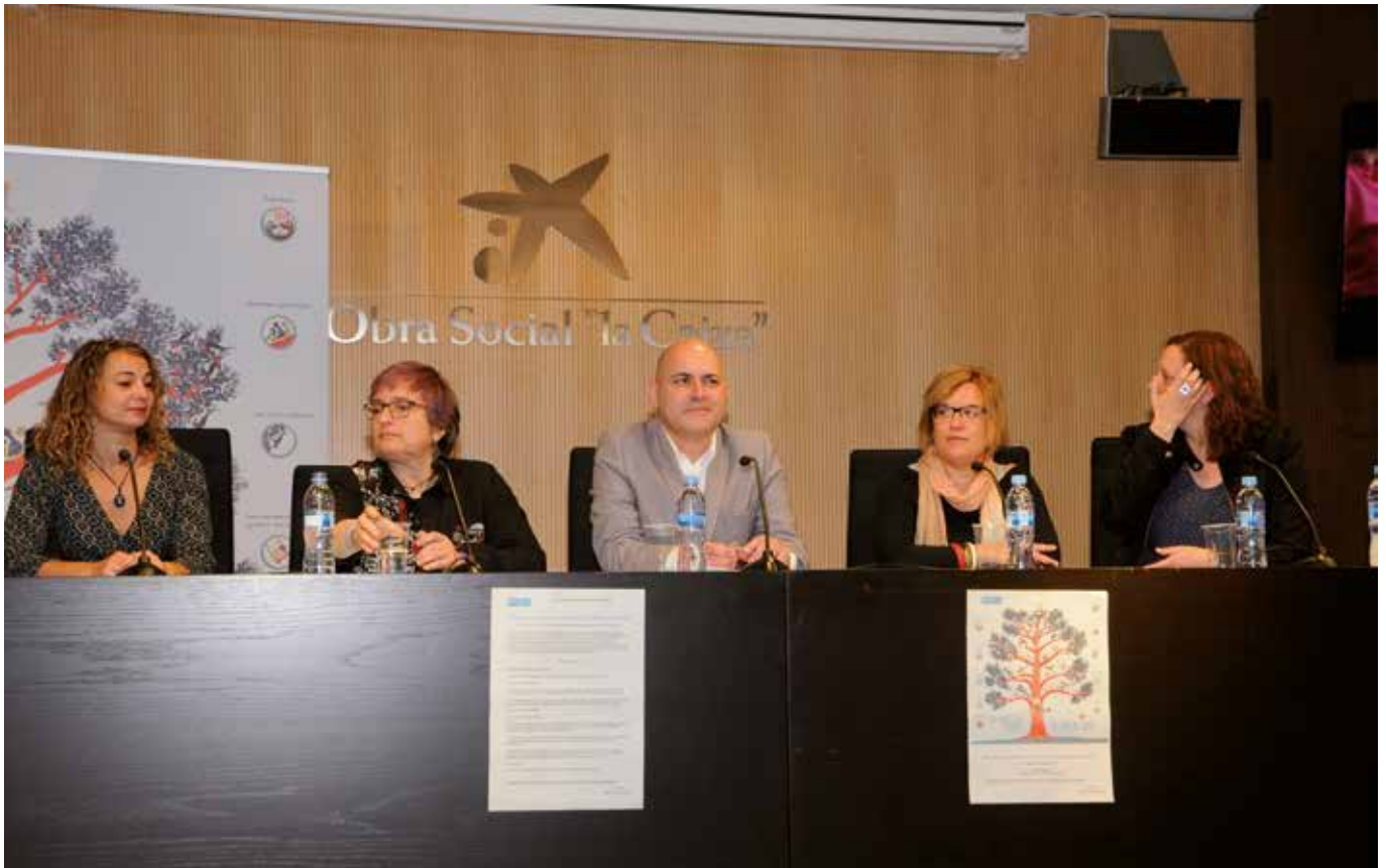
Inici de les Jornades a càrrec dels membres del Comitè de Protecció Infantil.

Les III Jornades tècniques d'Aldees Infants SOS realitzades el 3 de maig de 2018 es van presentar aquest cop força diferents de les dues altres edicions passades. Les anteriors edicions estaven basades en les participacions per grups, deliberacions conjuntes i diàlegs múltiples, sense abandonar la veu preuada dels principals protagonistes, els joves. En canvi, aquest any s'havia apostat per un nou format, més clàssic i alhora més directe però amb el mateix accent a l'opinió del públic jove. Un matí amb ponències d'experts en diferents temes com a eix vertebrador amb les reflexions finals. Enguany s'emmarcaven les jornades amb el concepte de mirada i és que les ponències s'encaraven