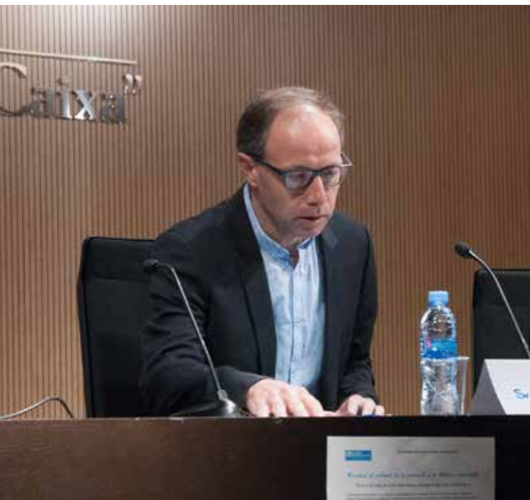
La mirada de l'ètica, plantejant dilemes que s'obren al voltant de la protecció infantil.

A mode de conclusió de la seva ponència va proposar, a tots els assistents de l'acte, dos dilemes relacionats amb la protecció i la mirada de l'ètica: