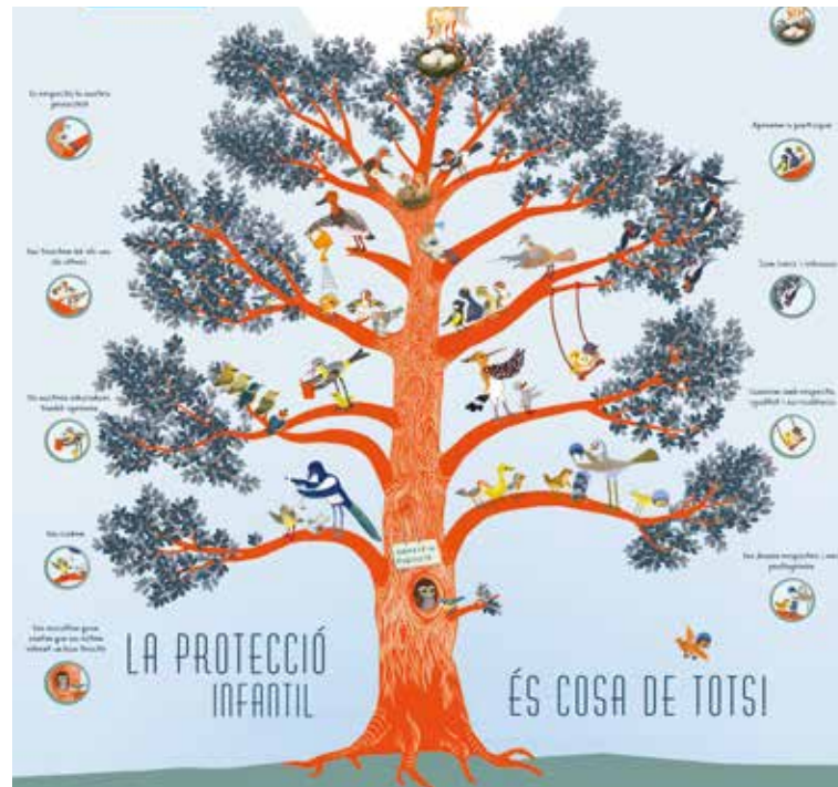
L'arbre de la protecció infantil.

Tanmateix es va presentar el Decàleg de Protecció Infantil i, també, la imatge identificativa de la protecció infantil, "l'arbre de la protecció" que teniu sobre aquestes línies i en la portada d'aquest document. Aquesta és una imatge que pretén apropar-se als més petits i fer veure les coses positives que aporta l'organització en el dia a dia, alhora que representa el Comitè de Protecció. De les seves branques en surten pensaments i reflexions dels joves, com ara: "es respecta la nostra privacitat" , "els nostres educadors aprenen també" o "ens donen respostes i ens protegeixen" . Totes elles representen els pilars fonamentals d'Aldees Infantils SOS al voltant de la protecció infantil.